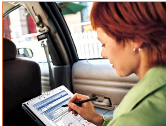
La mobilité, un atout essentiel pour le travail

"Chacun de nous disposait de son propre support de stockage (Palm, répertoires et agendas papiers) et nous perdions beaucoup de temps à retranscrire nos contacts respectifs dans le gestionnaire Microsoft Outlook géré par notre assistante. De plus, nous n'étions jamais certains que cette liste était à jour ni de la validité des coordonnées." Une liste de contacts qui devenait, par ailleurs, inaccessible en l'absence de l'assistante car la configuration de l'outil était limitée à son seul poste de travail. "Maintenant tout ajout dans le répertoire partagé Microsoft Exchange est immédiatement visible par chacun de nous." Il en est de même pour les agendas. "L'agenda partagé permet à mon assistante d'être certaine de ma disponibilité lorsqu'elle prend un rendez-vous. De plus, nous savons à tout moment où chacun se trouve." Enfin, le gestionnaire de tâches de Microsoft Exchange améliore de façon décisive la gestion des projets. "Chaque étape du cycle de vie d'un projet (devis, acceptation par le client, etc.) s'opère à travers l'échange de courriers électroniques qui sont désormais automatiquement stockés sous forme de tâches partagées. Cela nous permet à tout moment de connaître l'état d'avancement de l'ensemble des projets et de déclencher les phases suivantes."